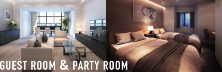
GUEST ROOM & PARTY ROOM