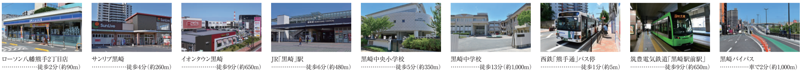
ローソン八幡熊手2丁目店 .....徒歩2分(約90m) サンリブ黒崎 .....徒歩4分(約260m) イオンタウン黒崎 .....徒歩9分(約650m) JR「黒崎」駅 .....徒歩6分(約480m) 黒崎中央小学校 .....徒歩5分(約350m) 黒崎中学校 .....徒歩13分(約1,000m) 西鉄「熊手通」バス停 .....徒歩1分(約5m) 筑豊電気鉄道「黒崎駅前駅」 .....徒歩9分(約650m) 黒崎バイパス .....車で2分(約1,000m)